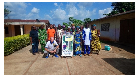
Besuch vor Ort 2023 in Benin

Seit vielen Jahren reist unser Vorsitzender auf eigene Kosten regelmäßig nach Benin, um unsere Projektpartner vor Ort zu treffen. Der persönliche Austausch und die Besprechung von Problemen stehen dabei im Vordergrund. Einige ausgewählte Projekte werden persönlich besucht, daher haben wir einen guten Einblick über den aktuellen Stand. Auch wenn wir regelmäßig per E-Mail oder WhatsApp in Kontakt mit unseren beninischen Partnern sind, haben persönliche Begegnungen eine ganz andere Qualität.