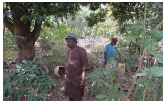
Ca. 30 Jahre alte Mangobäume in Soroko in der Nähe von Banikoara, die mit Hilfe von Pro Benin gepflanzt wurden

Um möglichst viele Pflanzler unterstützen zu können, werden kontinuierlich neue Dörfer in das Programm aufgenommen.