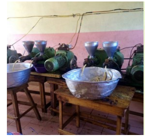
Pressen der Sojabohnen

Seit Bestehen des Vereins unterstützt dieser die Dorfgemeinschaft Soyo in Allada, die Sojabohnen zu hochwertigen proteinhaltigen Nahrungsmitteln verarbeitet. Diese sogenannten "Goussis", die sehr wertvoll für die Gesundheit sind, werden auf Märkten und im Direktverkauf im Süden von Benin seit vielen Jahren erfolgreich verkauft. Sie sind eine sehr gute Alternative zu dem teuren Fleisch oder Fisch.