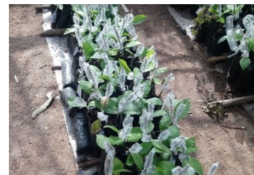
Setzlinge junger Cashew-Pflanzen