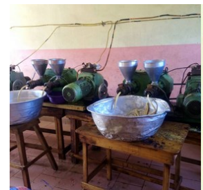
Pressen der Sojabohnen

Seit Bestehen des Vereins unterstützt dieser die Dorfgemeinschaft Soyo in Allada, die Sojabohnen zu hochwertigen proteinhaltigen Nahrungsmitteln verarbeitet. Diese sogenannten "Goussis", die sehr wertvoll für die Gesundheit sind, werden auf Märkten und im Direktverkauf im Süden von Benin seit vielen Jahren erfolgreich verkauft. Sie sind eine sehr gute Alternative zu dem teuren Fleisch oder Fisch.